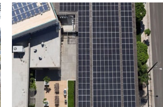
Handel detaliczny/magazyny/centra danych