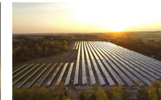
Instalacje wspólnot /Instalacje naziemne