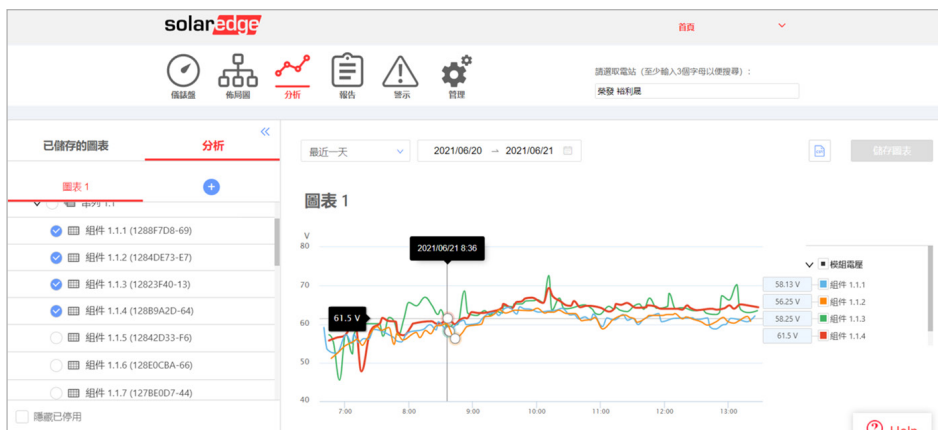
SolarEdge直覺化的監控平台可顯示每個模組的電壓數據