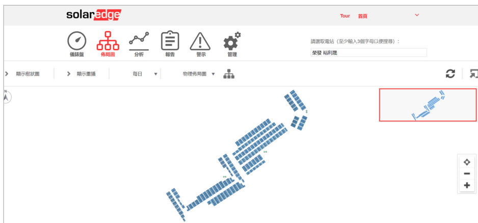
SolarEdge監控系統可顯示每一片模組的性能資料，模組的顏色代表模組的發電表現

監控平台提供的資料包括變流器輸出、功率優化器電壓、電流對模組電壓、互動式性能圖表、系統電站佈局等。