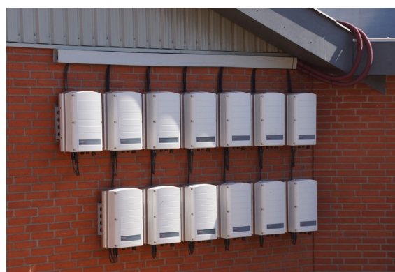
Hodowla trzody chlewnej w Sveigaard, Dania

Falowniki firmy SolarEdge są objęte 12-letnią gwarancją, którą można przedłużyć do 20 lat.