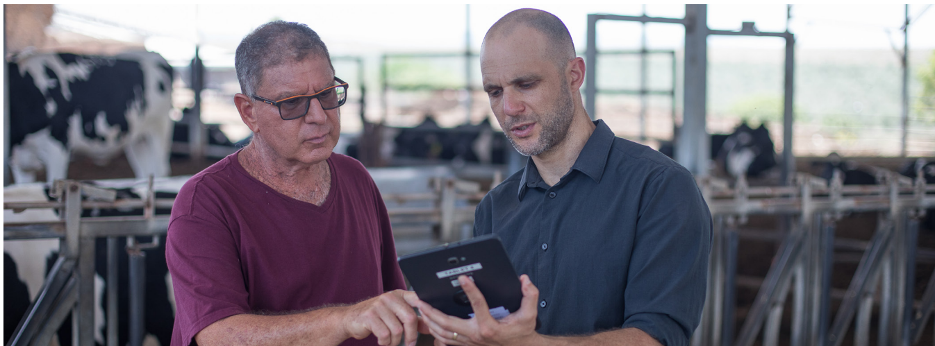
Kibbutz Gal-Ed, Izrael

Systemy fotowoltaiczne wyposażone w rozwiązanie firmy SolarEdge współpracują ze sobą bezproblemowo, zapewniając maksymalną moc i wydajność przy jednoczesnym zmniejszeniu kosztów energii i zależności od lokalnej sieci energetycznej.