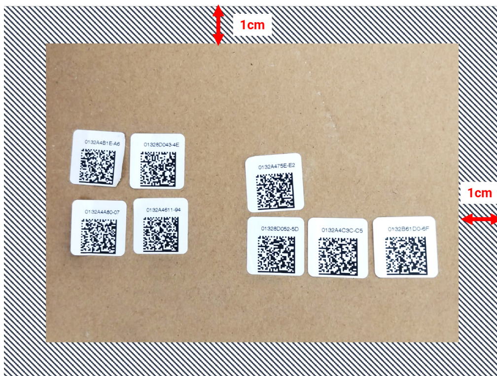
Figura 1: ejemplo de códigos QR

Se puede utilizar cualquier cámara disponible, incluidas las cámaras de los smartphones, para capturar una imagen de los adhesivos de códigos de barras.