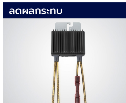
ลดผลกระทบ

ตรวจจับความเสี่ยงในการเกิดอาร์คได้ล่วงหน้าด้วย Sense Connect และแจ้งเตือนในมอนิเตอร์รีંગแพลตฟอร์มแบบเรียลไทม์และบอกตำแหน่งอย่างแม่นยำ