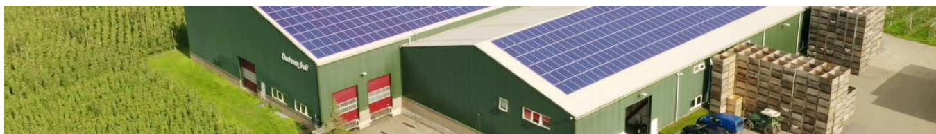
System SolarEdge zainstalowany w Oostveen Fruit Farm w Holandii wygenerował w pierwszym roku 285 660 kWh – 120% z obiecanych 237 946 kWh

Dzięki systemowi inteligentnej energii firmy SolarEdge zyskujesz spokój ducha, który towarzyszy wyborowi Najlepszemu na świecie dostawcy systemów fotowoltaicznych z najlepszą technologią i najdłuższymi gwarancjami. Optymalizatory mocy firmy SolarEdge zyskują więcej energii z każdego modułu PV, przyczyniając się do większej mocy dostarczanej w całym okresie eksploatacji systemu, co przekłada się na niższy całkowity koszt posiadania (TCO). Twoje zasoby i konstrukcje są chronione dzięki innowacyjnym zabezpieczeniom, takim jak opatentowana funkcja SafeDC™ oraz wykrywanie i przerywanie łuku. Nasza platforma monitorowania na poziomie modułów zapewnia w czasie rzeczywistym informację o produkcji energii i zużyciu na smartfonie lub komputerze.