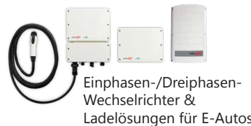
Einphasen-/Dreiphasen-Wechselrichter & Ladelösungen für E-Autos