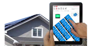
Monitoring auf Modulebene