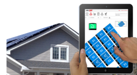
Monitorowanie na poziomie modułów