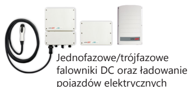
Jednofazowe/trójfazowe falowniki DC oraz ładowanie pojazdów elektrycznych