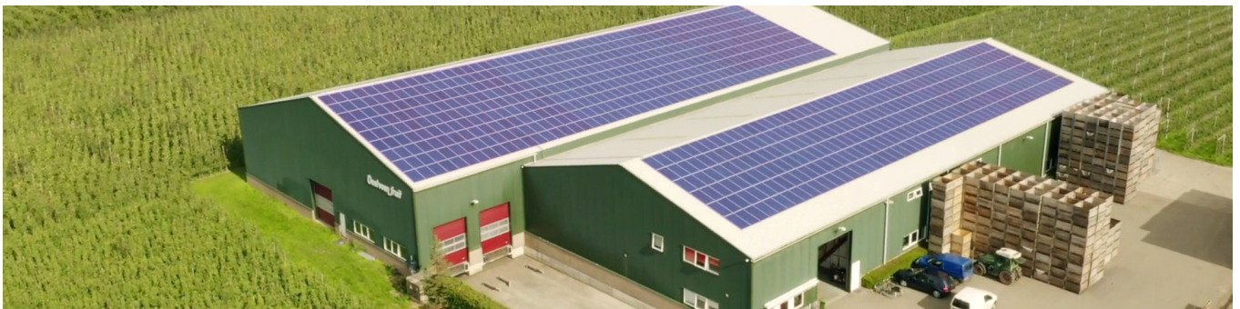
SolarEdge-systemet för Oostveen Fruit Farm i Nederländerna, genererade 285 kWh under det första året - 20 % mer än de 237 kWh som beräknades

Med SolarEdges smarta energisystem kan du känna dig trygg då du har valt världens ledande företag av solenergisystem med den bästa teknologin och de längsta garantierna. SolarEdges effektoptimerare ger mer energi från varje solpanel, vilket betyder högre energiproduktion och att den totala ägandekostnaden minskar sett under systemets hela livslängd. Dina tillgångar och byggnader skyddas med innovativa säkerhetsfunktioner, som den patenterade funktionen SafeDC™ och ljusbågsdetektering och -brytare. Vår monitoreringsportal ger dig en realtidsöversikt av energiproduktion och -användning, på modulnivå. Direkt i din smartphone eller dator.