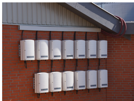
Sveigaard svingård, Danmark

* Beroende på bestämmelser i respektive land