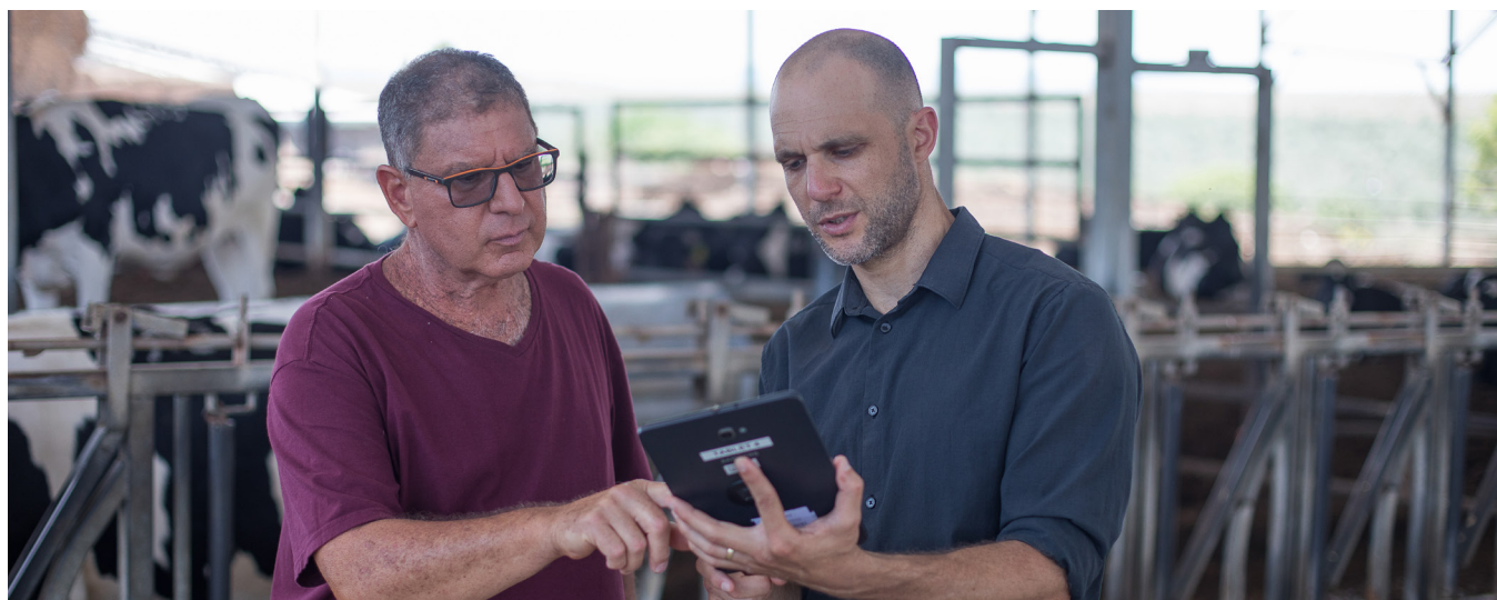
Kibbutz Gal-Ed, Israel

Solcellssystem med lösning från SolarEdge fungerar sömlöst tillsammans för att ge maximalt energi, samtidigt som du sänker elräkningen och minskar ditt beroende av det allmänna elnätet.